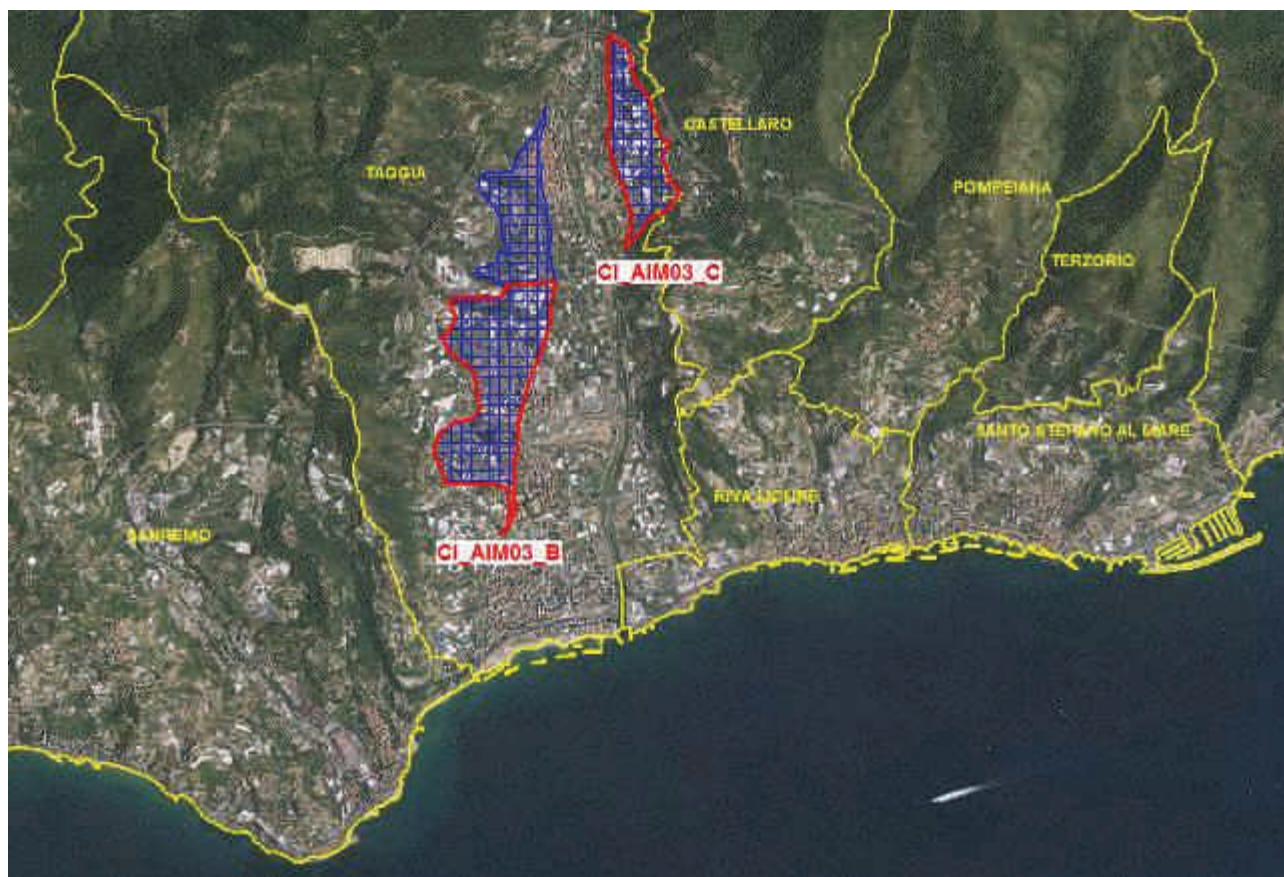
Figura 4. Rappresentazione cartografica (perimetro rosso) delle aree di acquifero critiche per la presenza di nitrati, corrispondenti con il corpo idrico sotterraneo CI_AIM03_C e con la parte meridionale del corpo idrico sotterraneo CI_AIM03_B (retinatura blu).

Per l'area ZVN di Albenga e Ceriale il trend dei valori di nitrati riscontrati nei pozzi oggetto di monitoraggio mostra un andamento in leggero calo, ma pur sempre superiore al limite massimo di 50 mg/l imposto dalla normativa, Si evidenzia, pertanto, la necessità di mantenere la designazione dell'area e l'applicazione del Programma di Azione che è necessario aggiornare per il sessennio di riferimento dell'ultimo Piano di Tutela delle Acque approvato (2016-2021). Tale Programma di Azione deve essere seguito e rispettato sia nell'area ZVN già designata di Albenga e Ceriale, che nella nuova area ZVN del bacino del torrente Argentina.