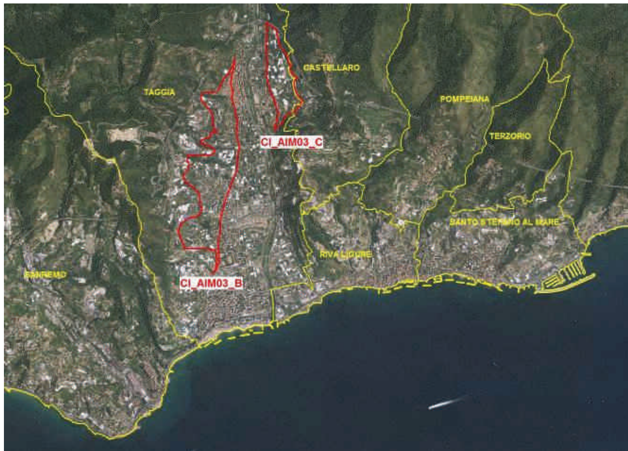
Figura 3. Rappresentazione cartografica (perimetro rosso) dei corpi idrici sotterranei CI_AIM03_B e CI_AIM03_C, presso l'acquifero del torrente Argentina (tratta dal Piano di Tutela delle Acque di cui alla DCR 11/2016); la parte centrale dell'acquifero è costituita dal corpo idrico CI_AIM03_A che non presenta criticità significative per la concentrazione di nitrati.

Per quanto riguarda l'acquifero del torrente Argentina il Piano di Tutela delle Acque ha già portato ad una perimetrazione dei corpi idrici sotterranei, su base idrogeologica, mirata a delimitare con maggiore precisione la criticità legata ai nitrati, come mostrato nella figura 3.