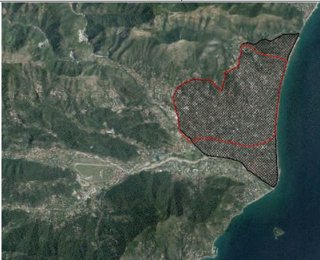
Figura 1: il perimetro rosso indica la Zona Vulnerabile ai nitrati di cui alla DGR 1256/2004, la retinatura nera indica il perimetro del corpo idrico sotterraneo CI_ASV01_B

Come si evince dalla figura 1 il perimetro della ZVN albenganese (perimetro rosso) risulta interamente compresa nel corpo idrico sotterraneo (perimetro e retinatura nera): il lieve sconfinamento lungo il confine sudoccidentale rappresenta un particolare grafico privo di significato idrogeologico e risulta pertanto opportuno correggere in tal senso la geometria della ZVN.